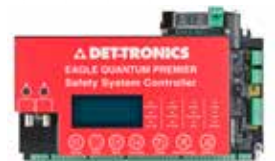
Sistema de seguridad Eagle Quantum Premier®