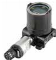
Pantalla universal FlexVu® con detector de gases tóxicos GT3000