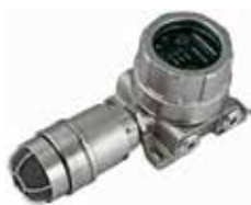
Detector de fugas acústicas FlexSonic®