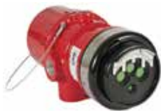
Detector de llama IR multiespectro X3301