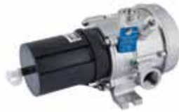
Detector de gas combustible IR PointWatch Eclipse®