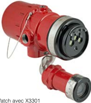
xWatch avec X3301